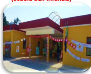
Plesso "Via Giotto" (Scuola dell'Infanzia)