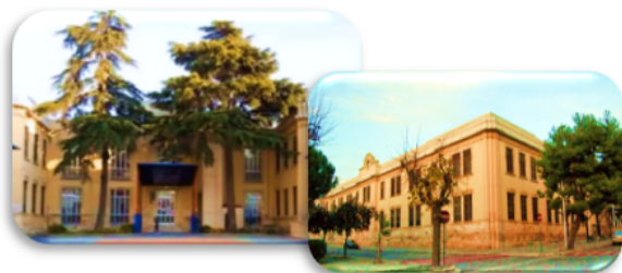
Plesso "G. Falcone" (Scuola Primaria)