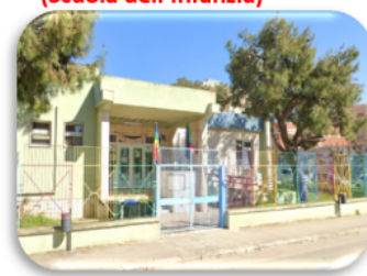
Plesso "A. Seveso" (Scuola dell'Infanzia)